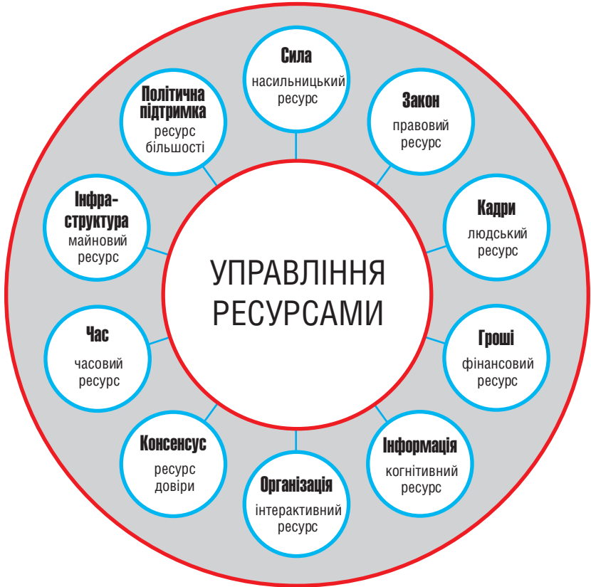
Рис. 4. Ресурси публічної політики