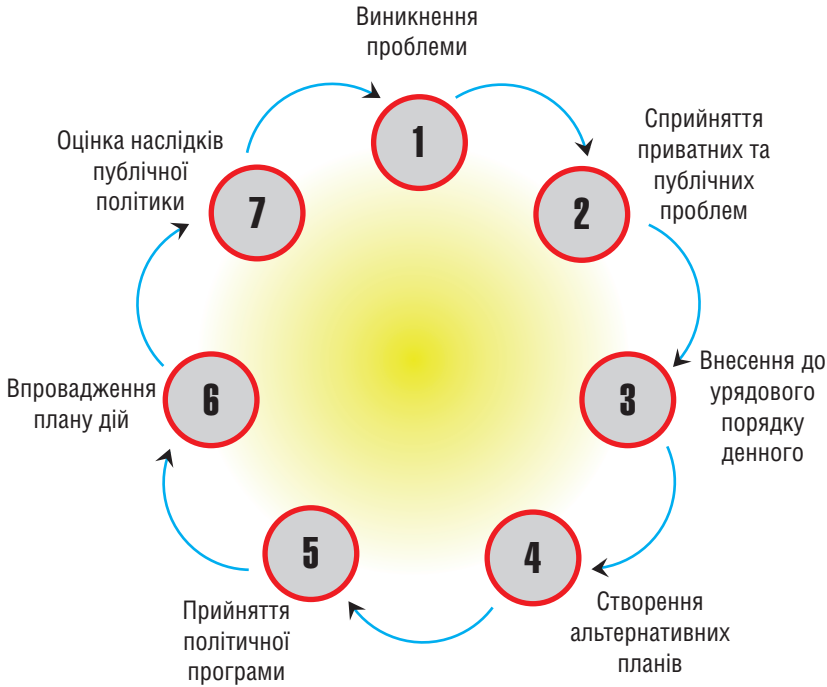
Рис. 2. Цикл публічної політики